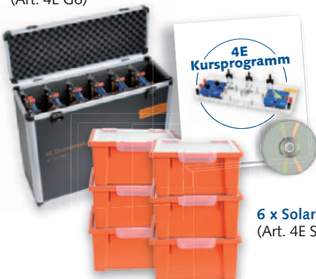
4E Kursprogramm Ringbuchordner + CD (Art. 4E K1)